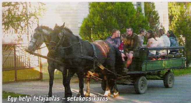
Egy helyi felajánlás – sétakocsikázás