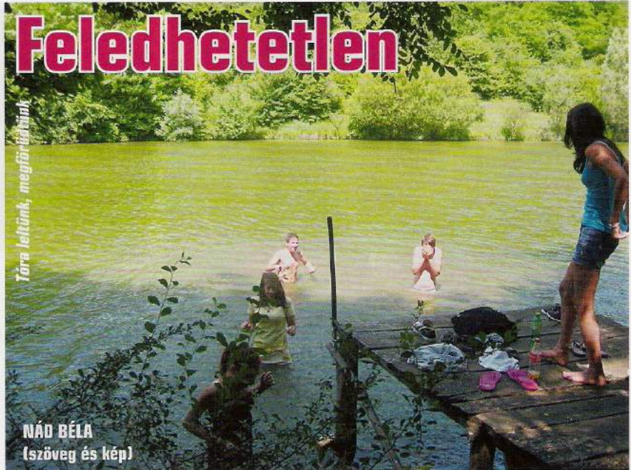
Tóra lelkünk, megfőtésünk