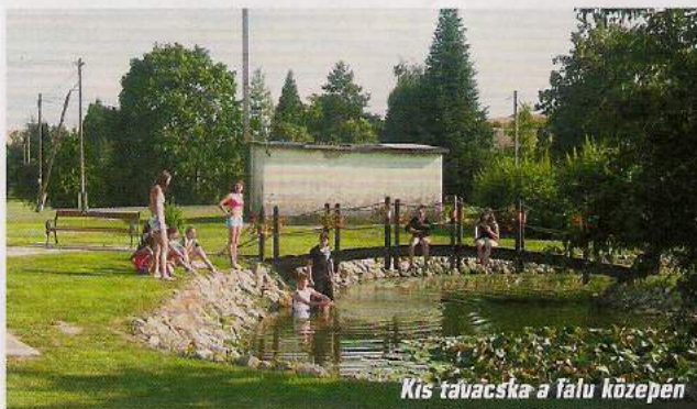
Kis tavacska a falu közepén

Elteltek a napok, nem tettük ki a lábunkat Fekedről, mégis többet értek ezek a kurtának tűnő napok, mintha kaland- és élményparkokban múltunk volna az időt. Együtt mi huszonketten, no és közel kétszáz fekedei. Amikor indultunk haza, gyerekeim nyúztak: Mikor jövünk ide megint? Mert Feked egy olyan hely, ahová jó visszatérni!