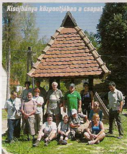
Kisújbánya központjában a csapat

utat választottuk, a találkozó Óbányára beszéljük meg. Felsétáltunk a mesés Óbányai-völgyön Kisújbányára. Utunkat csörgedező, firkádozó patak és évszázados fák árnya kísérte. Rácsodálkoztunk a Ferde-vízesésre. Kisújbányán nagy örömmre a fejlődés köszönt ránk. Újuló, szépülő faluközpont és templom. Egyik túratársam észrevett egy kis enyhelyet, egy háziszörpöket és langallót kínáló kis oázist. Jó látni egy feltámadóban lévő települést.