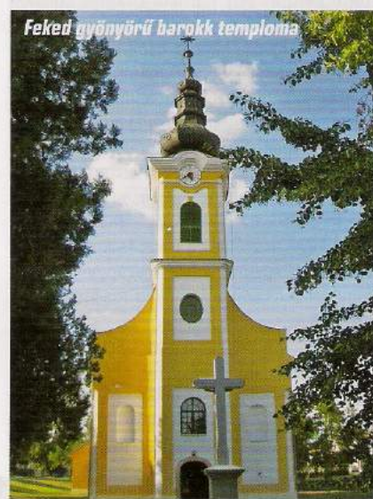
Feked gyönyörű barokk temploma