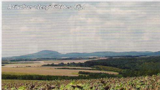
A távolban a Zengő tálti be a tájat