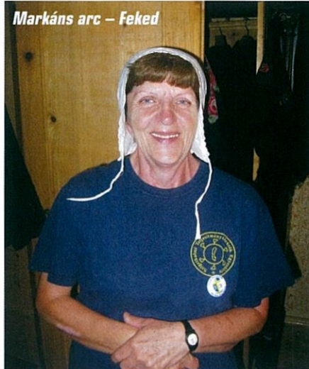
Markáns arc – Feked

Jött a farsang, amiről tudni köll, ha rövid, csak a szép lányok kelnek el – na ezért hosszú! Így van esélye a „kevessé csinokának” is. Megtudtuk, hogy itt a harangok nem Rómába, hanem a mennyországba repülnek nagycsütörtökön. Az utolsó bált november 25-én, Katalin napján tartották – Katalin bezárja a hegedűt. Ha a gyerekek karácsonykor meglátták a lenyugvó nap párját, azt mondták, hogy Jézuska kalácsot süt.