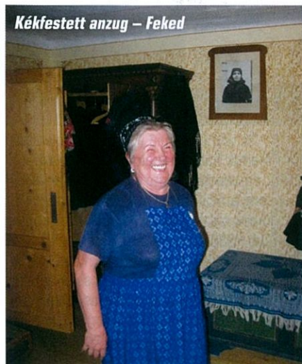
Kékfestett anzug – Feked

Ahogy múltak a percek, lett egyre személyesebb a beszélgetés. Úgy kerültek a tárgyak köré