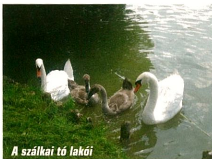
A szálkai tó lakói