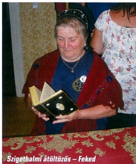
Szigethalmi átöltözős – Feked