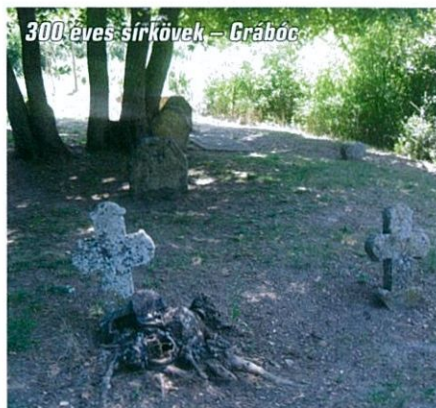
300 éves sírkövek – Grábóc

Sokáig folytathatnám a felsorolást. Bizony bölcs volt a mi nagy királyunk, mert a német kisebbség – benne a fekediek – jelentősen hozzájárult a „mi közös zamatunkhoz”.