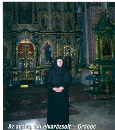
Az apáca, aki elvarázsol – Grábóc