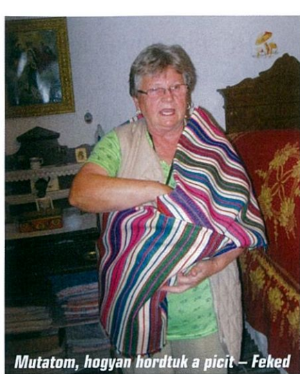
Mutatom, hogyan hordtuk a picit – Feked

asszonyok a munkába. Egy egyszerű kötő segítségével máris ott sivalkodhatott a picit az anyja pociján. Fel is bátorodtak a sporttársak. A szekrényekből előkerült pruszlikok, mellyesek, főkötők pár perc múlva ott ékeskedtek rajtuk. Kattogtak a fotómasinák. Ott peckeskedtek hölgyeink az egyszerűségükben is csodálatos fekete-fehér vagy éppen sötétkék (a kékfestők remekei) ruhákban, fejükön különféle főkötőkkel. A pokol akkor szabadult el, mikor előkerült egy közel száz esztendő lakodalmi „darab”. A ruha egyetlen szerencséjének az bizonyult, hogy egykori gazdája nádszál karcsú volt. Hogy gonosz legyenek: így csak nézni tudták amazonjaink.