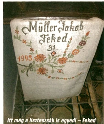
Itt még a liszteszák is egyedi – Feked